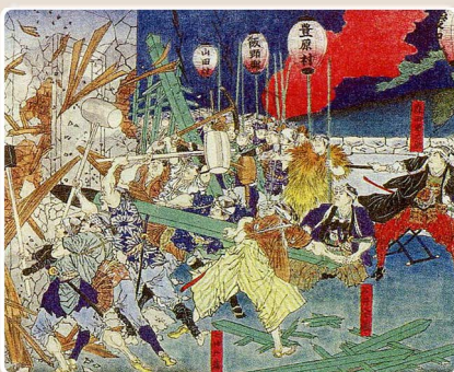
絵 / 「三重県下頰民暴動之事件」(月岡芳年画)

1876年(明治9年)地価の3%を、米の豊凶によらず地租として徴収する地租改正に反対して各地で起こった「一揆」。なかでも最大規模の一万人以上が軽減を求めた「伊勢暴動」は三重県から始まりました。近隣県まで拡大した結果、受刑者は五万人を超えたといわれています。四日市もこの騒動の中心の一つで、これにより、税率は2.5%に引き下げられました。